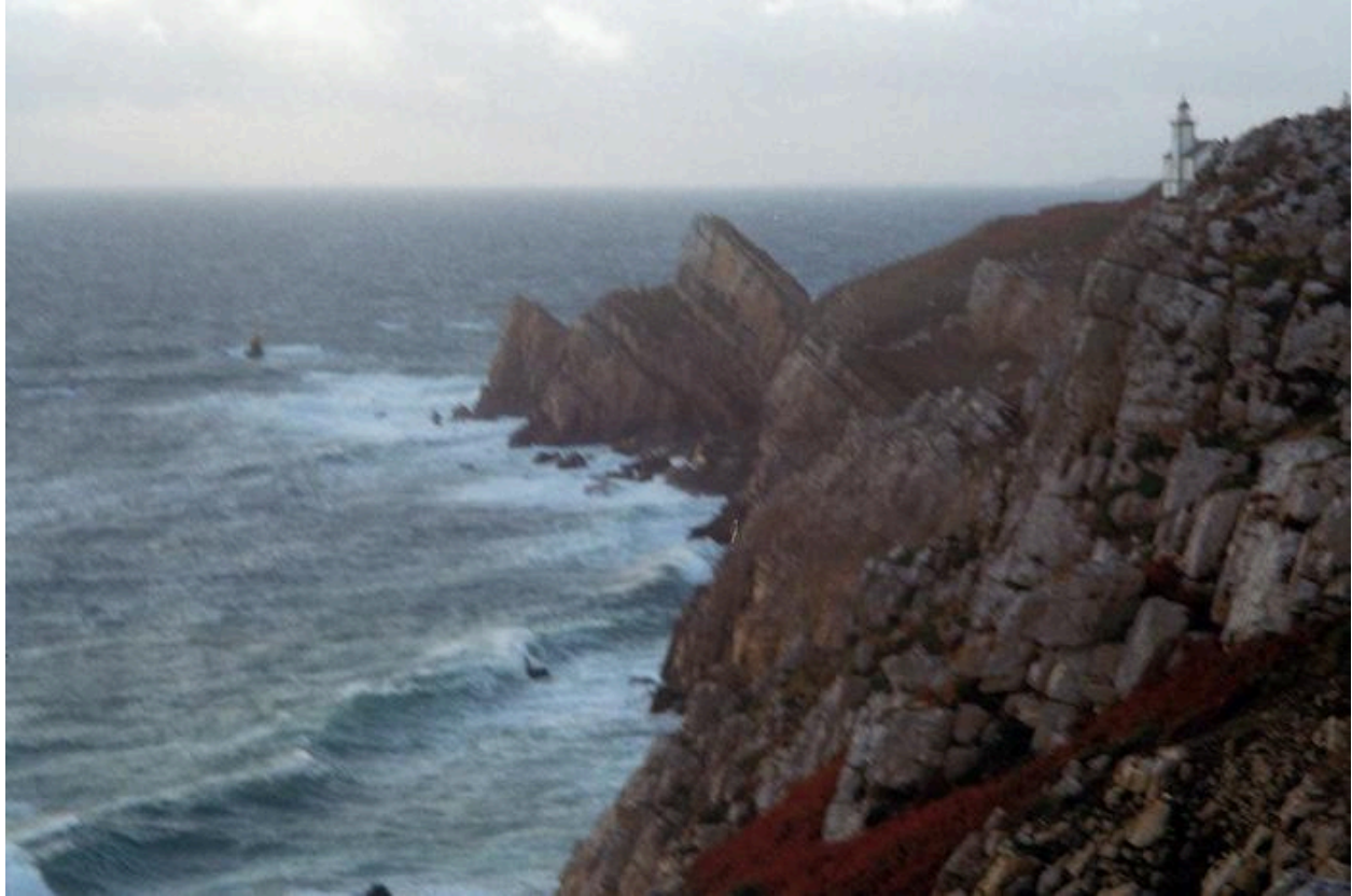
la bretagne enfalaisée