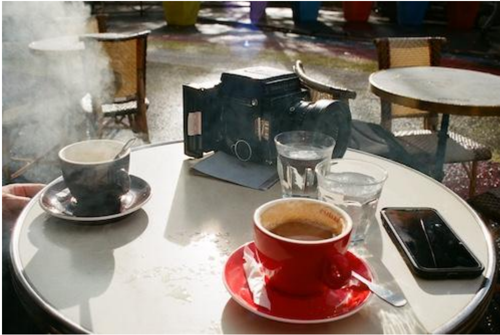
café richard, jouxtant le père-lachaise

paris – nantes – crozon de élisabeth à toi