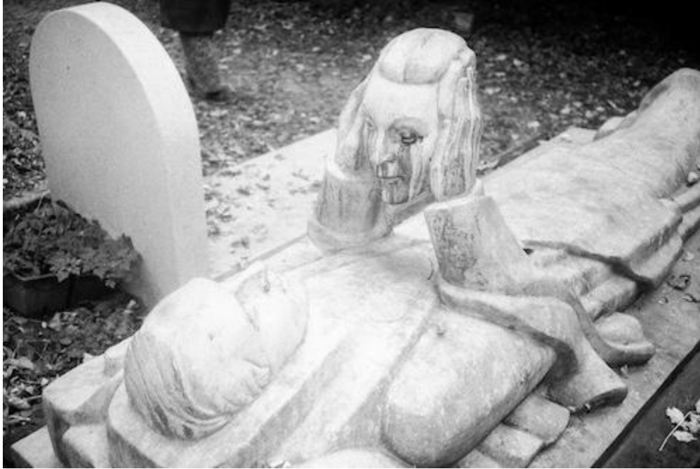
dracula au père-lachaise

double édition sans frais du projet ocre début décembre → @leprojetocre