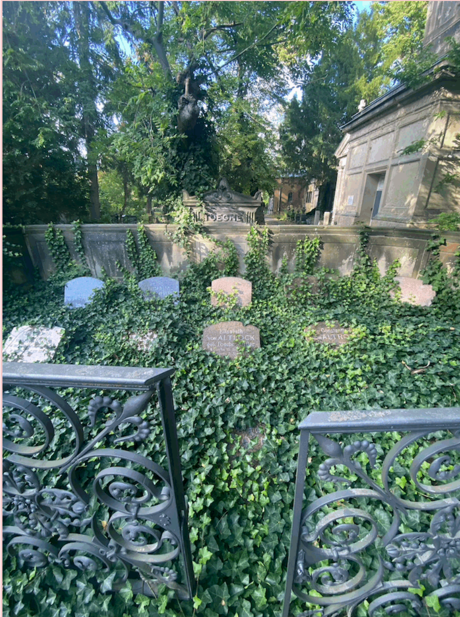
cimetière touffu près de la station mehringdamm, berlin

« protéger ceux qu'on aime revient à enfileur un costume de carnaval. prétendre et voiler l'occulte. »