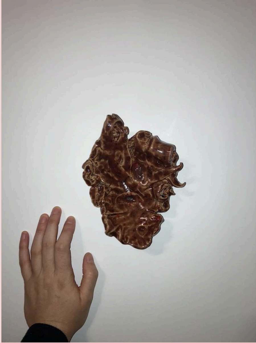
le coeur, 2023